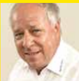
Harald Zecchinell Veranstaltungen