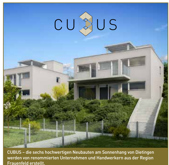
CUBUS – die sechs hochwertigen Neubauten am Sonnenhang von Dietingen werden von renommierten Unternehmen und Handwerkern aus der Region Frauenfeld erstellt.