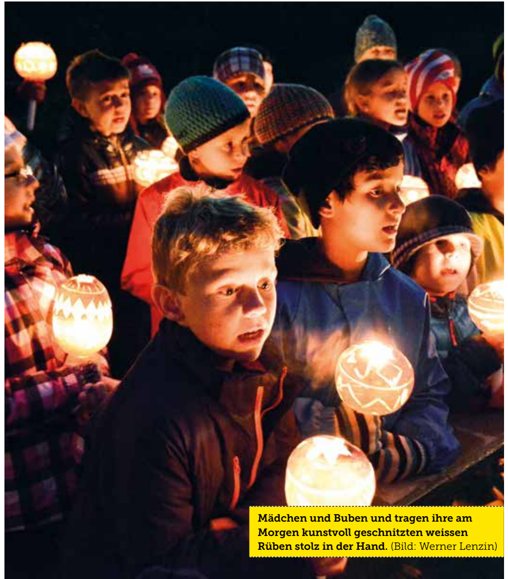
Mädchen und Buben und tragen ihre am Morgen kunstvoll geschnitzten weissen Rüben stolz in der Hand.