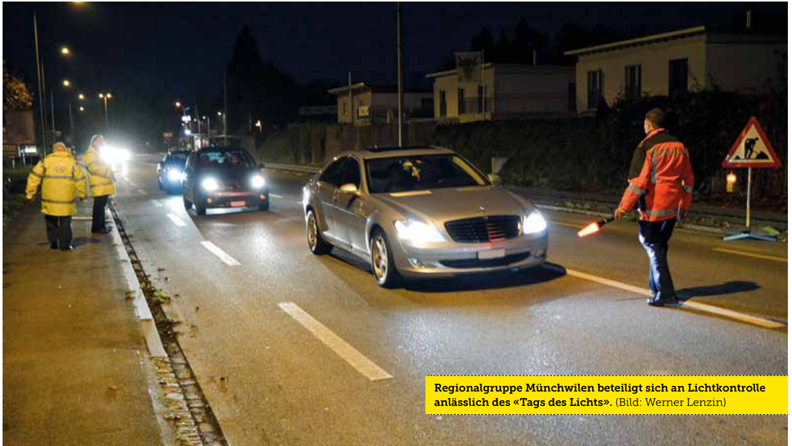
Regionalgruppe Münchwilen beteiligt sich an Lichtkontrolle anlässlich des «Tags des Lichts».

«See you – mach dich sichtbar» lautete das Motto des nationalen Aktionstages zum «Tag des Lichts» vom 13. November. Die Regionalgruppe Münchwilen beteiligte sich zusammen mit acht Polizisten des Hauptpostengebiets Münchwilen und Rickenbach mit einer Lichtkontrolle an dieser Aktion. Wegen eines bewaffneten Raubüberfalls fand diese allerdings ein frühzeitiges Ende.