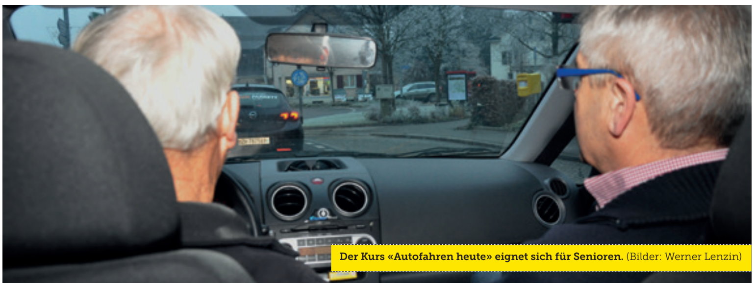
Der Kurs «Autofahren heute» eignet sich für Senioren.