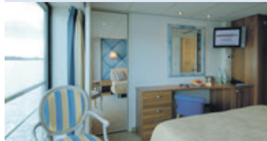
2-Bettkabine Oberdeck mit französischem Balkon

Rabatt Fr. 200.– bereits abgezogen, Mitteldeck vorn