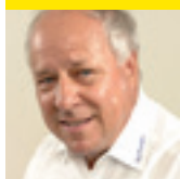
Harald Zecchin Veranstaltungen